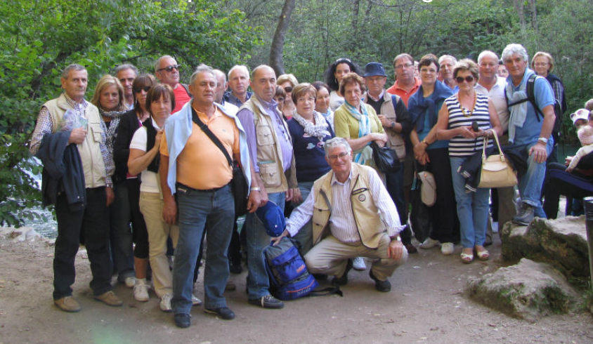
La comitiva nel parco nazionale dei Laghi di Plitvice

Con ogni probabilità, la gita di tre giorni dell'anno venturo proveremo ad anticiparla al mese di giugno.