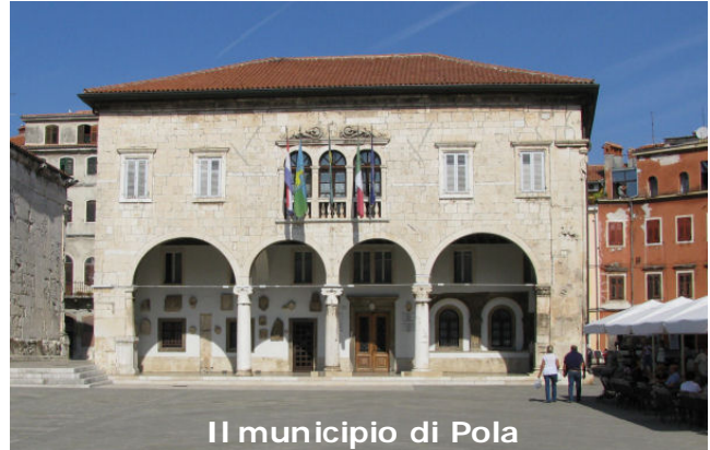
Il municipio di Pola

Una bella e salutare passeggiata di circa 7/8 chilometri complessivamente, inframezzati da due brevi tragitti in battello. Va detto che i luo-