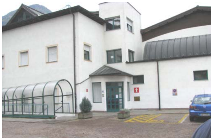
La palestra comunale di Bronzòlo, dove saremo alloggiati per l'adunata nazionale di Bolzano

Quanti fossero interessati a partecipare alla prossima Adunata Nazionale, sono invitati a dare fin d'ora la loro adesione in baita, versando l'acconto di € 50,00.