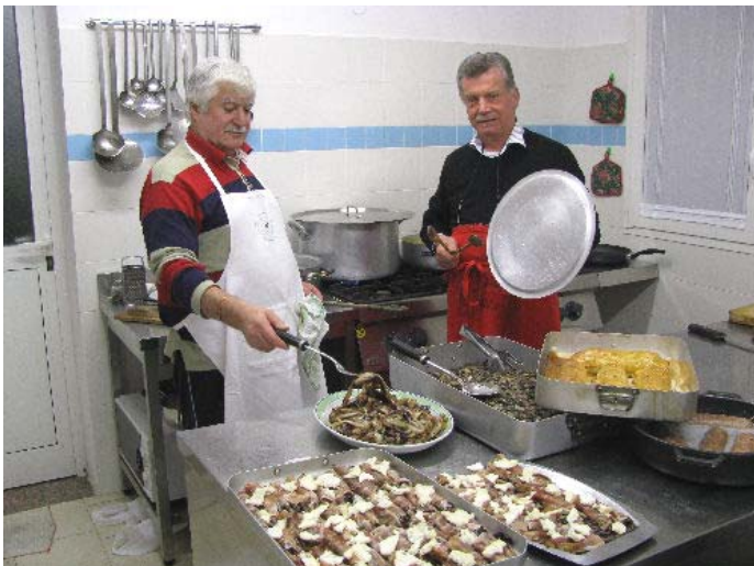
I cuochi all'opera

Verso l'una e mezza i primi rientri, mentre gli ultimi, come al solito i più forti e resistenti che non si sono fatti mancare neanche la prima partita a scopa dell'anno, hanno tirato verso le quattro con la soddisfazione di tutti i partecipanti che si sono dati appuntamento al 31 dicembre prossimo. Buon anno!