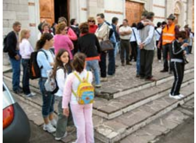
Il raduno dei partecipanti sul sagrato della Chiesa

Ripetuto anche quest'anno il pellegrinaggio in collaborazione con la parrocchia