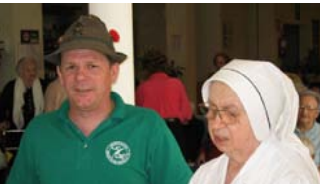
Anche la Superiora partecipa, come sempre, ai canti degli Alpini