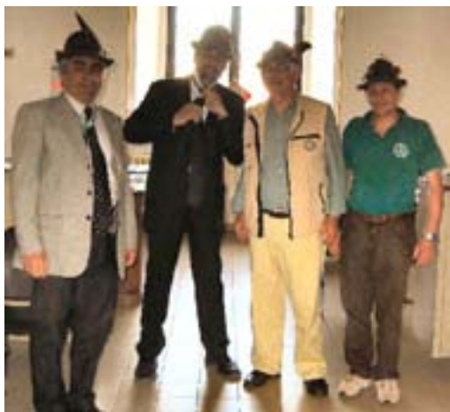
L'incontro con il Presidente del Comitato organizzatore (che si sta' infilando la cravatta)