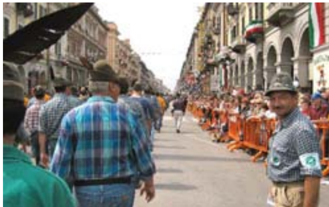
Un significativo momento della grande sfilata