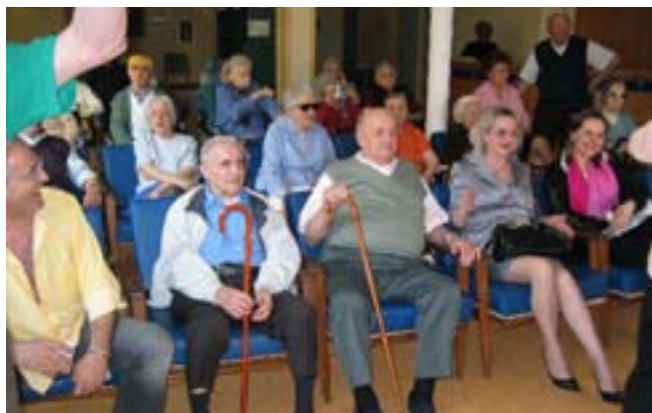
Ospiti di Villa Belvedere e familiari seguono con simpatia l'esibizione della Gnuco Band

del Cimitero di Ciano. La cerimonia si è conclusa con la deposizione di una corona al Monumen-