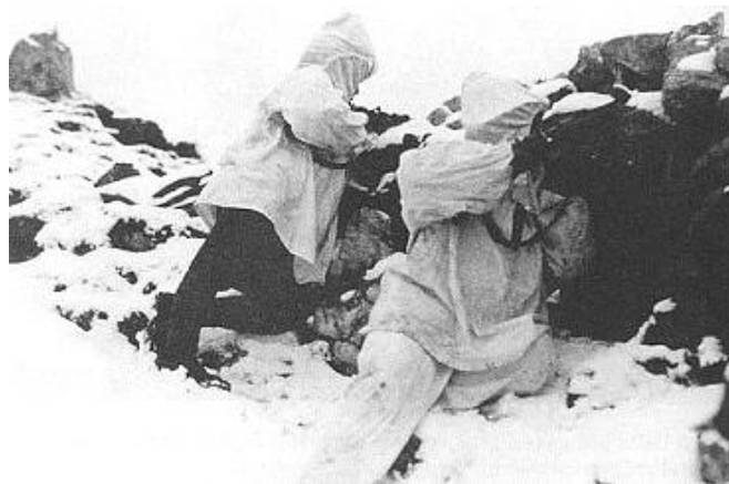
Guerra in montagna con freddo e neve

silenzio ossessivo, e sopra tutto il continuo presentimento del rischio improvviso, del risvegliarsi dell'inferno per il tuo corpo e per la tua anima, dannato forse a morire nel giro d'un'ora; ma, per intanto,, angosciosa e sempre uguale, appiccicosa e viscida come quella carcassa di