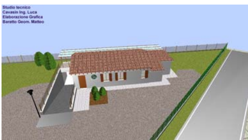
Studio tecnico Cavalese Ing. Luca Elaborazione Grafica Baratto Geom. Matteo