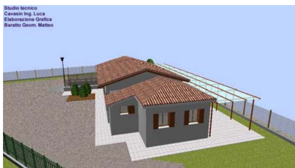
Studio tecnico Cavasin Ing. Luca Elaborazione Grafica Baratto Geom. Matteo