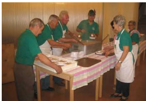
È pronta la pastasciutta