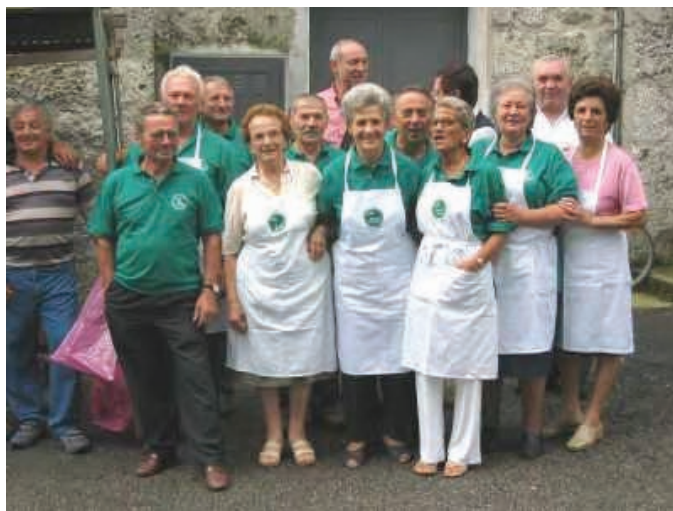
La squadra quasi al completo (con qualche infiltrato)

Deciso quindi per la parrocchia, ci siamo di conseguenza messi all'opera e così già nella mattina-