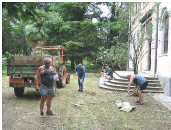
Un momento dei lavori

Per l'anno prossimo, appena agibile, chiederemo di poter organizzare una festa nel parco che merita davvero di essere vissuto.