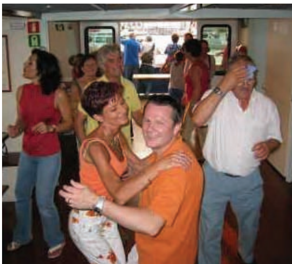
La festosa atmosfera a bordo della Fenice

Saranno, peraltro come tutti coloro che vengono a trovarci, i benvenuti.