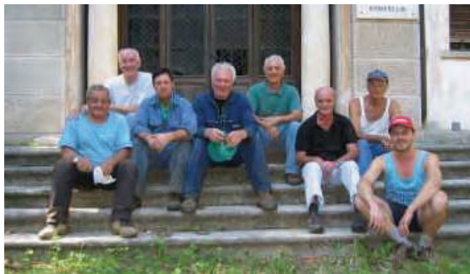
Quelli che "Il Pontello..." quasi al completo