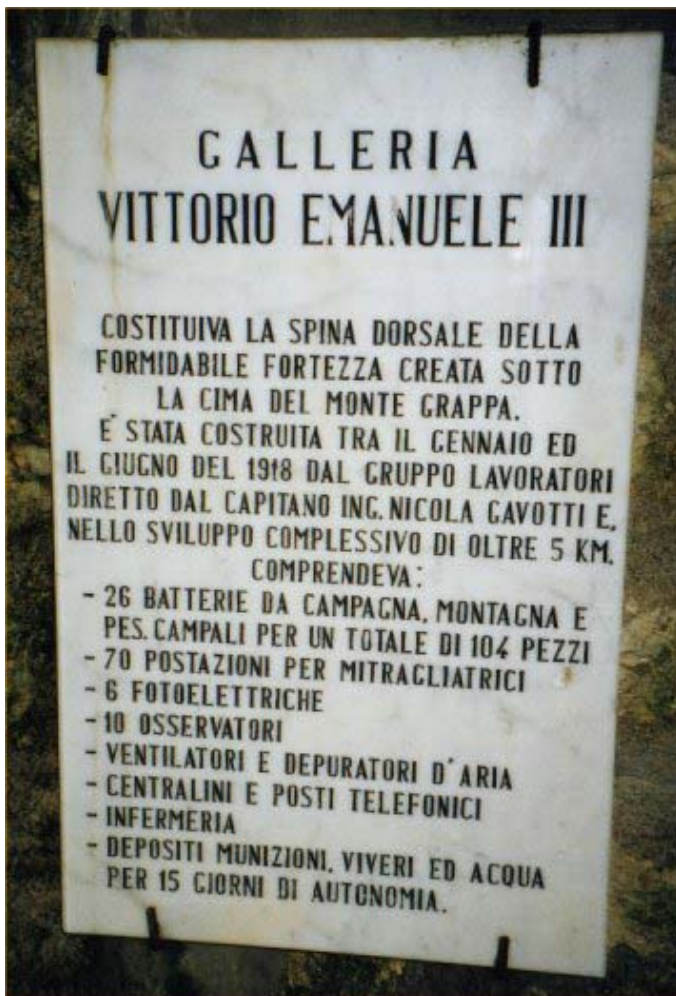
La lapide che si trova all'ingresso della galleria "Vittorio Emanuele III"

rancio, perché anche le baionette erano state perdute. Morti in un'esplosione di furore eroico, perché la sera avanti avevano udito — magari — un grido di donna giungere portato dal vento dalla conca di Alano; o veduto una lingua di fuoco salire nel buio da qualche casolare bruciato; o pensato con nostalgia più struggente a una casa lontana dove da troppo tempo non mettevano piede perché la guerra non finiva mai ed ora gli