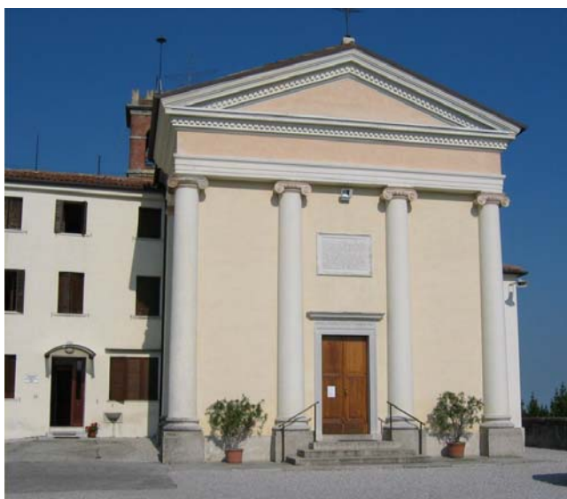
Il Santuario della Madonna della Rocca di Cornuda, mèta dela nostra passeggiata-pellegrinaggio

maggio cade di domenica e al mattino si svolgono in Parrocchia le normali funzioni religiose per cui, d'accordo con Don Paolo, il pellegrinaggio lo faremo nel pomeriggio.