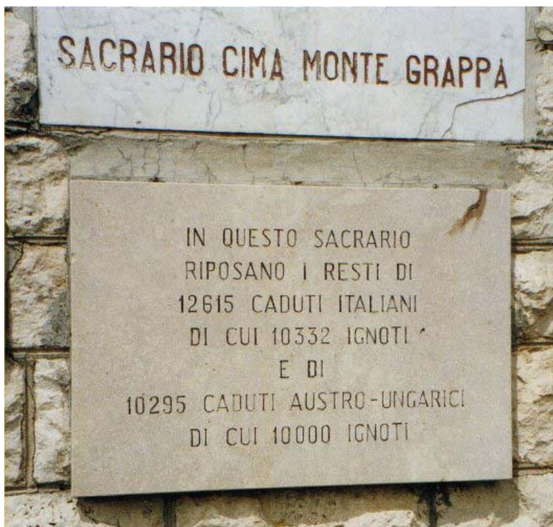
La lapide, molto eloquente, posta all'ingresso del Sacrario del Monte Grappa

Se si tracciano due assi in quel territorio, per misurarne l'estensione, quella maggiore - da sud-ovest a nord-est - risulterebbe di 28 chilometri, quella minore - da est ad