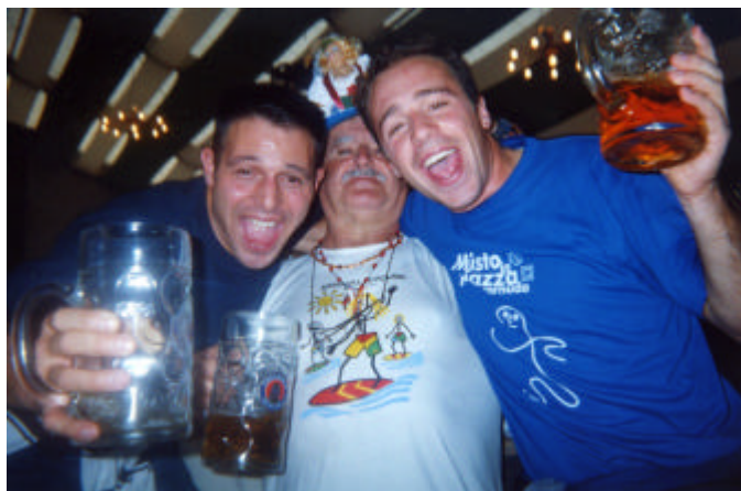
...e quelli più "allegrosi"

Albergo ottimo (pur con l'imprevisto delle camere... matrimoniali che ha "costretto" qualcuno, meno adattabile, a dormire sul pavimento) e, soprattutto, situato in posizione molto, ma davvero molto buona, a poche centinaia di metri dalla stazione ed a circa metà strada tra la sede della festa della birra ed il centro storico di Mo-