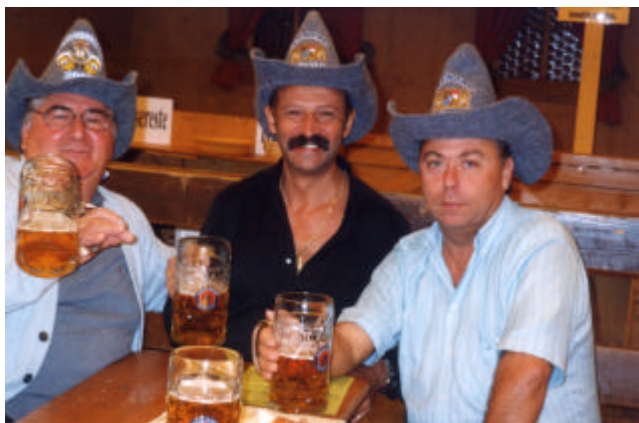
Quelli... un po' "seriosi"...