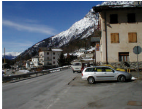
Una veduta di Bionaz

CONTINUIAMO A RACCOGLIERE LE ADESIONI PER LA GITA A MONACO DI BAVIERA PER OKTOBERFEST 2003. INFORMAZIONI, COME PER ADUNATA NAZIONALE.