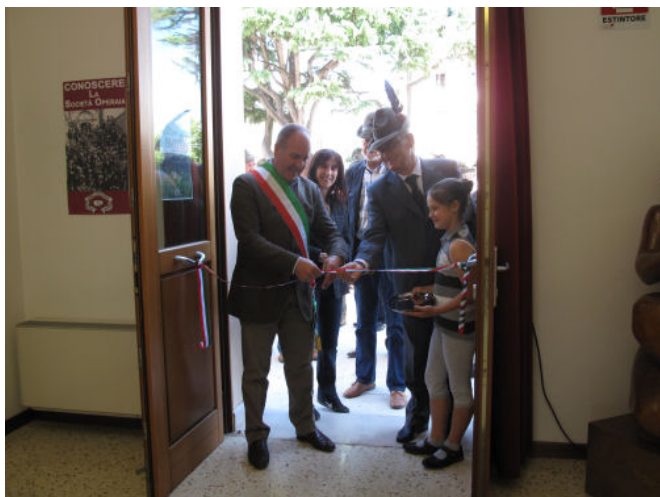
Il Sindaco taglia il nastro