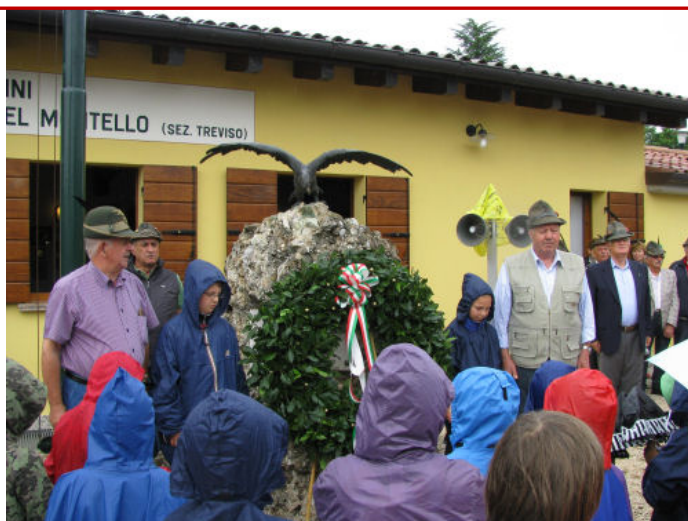
I bambini, gli insegnanti e gli alpini rendono gli Onori ai Caduti dopo l'Alzabandiera

Non senza però esprimere la nostra grande soddisfazione, che speriamo condivisa anche dagli insegnanti, e l'auspicio che nel prossimo anno scolastico sia possibile ripetere l'esperienza. Se la scuola chiama gli alpini, per quanto possibile, sono a disposizione.