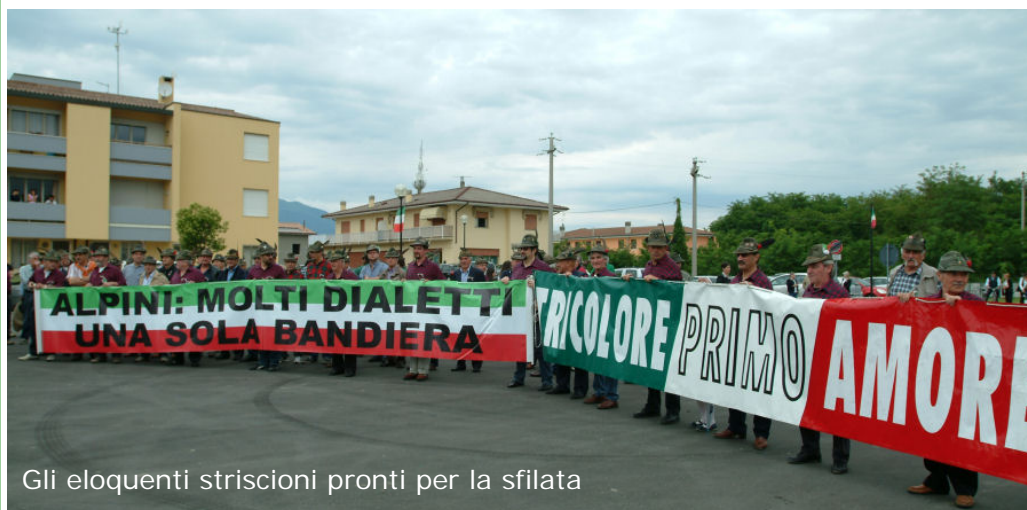
Gli eloquenti striscioni pronti per la sfilata