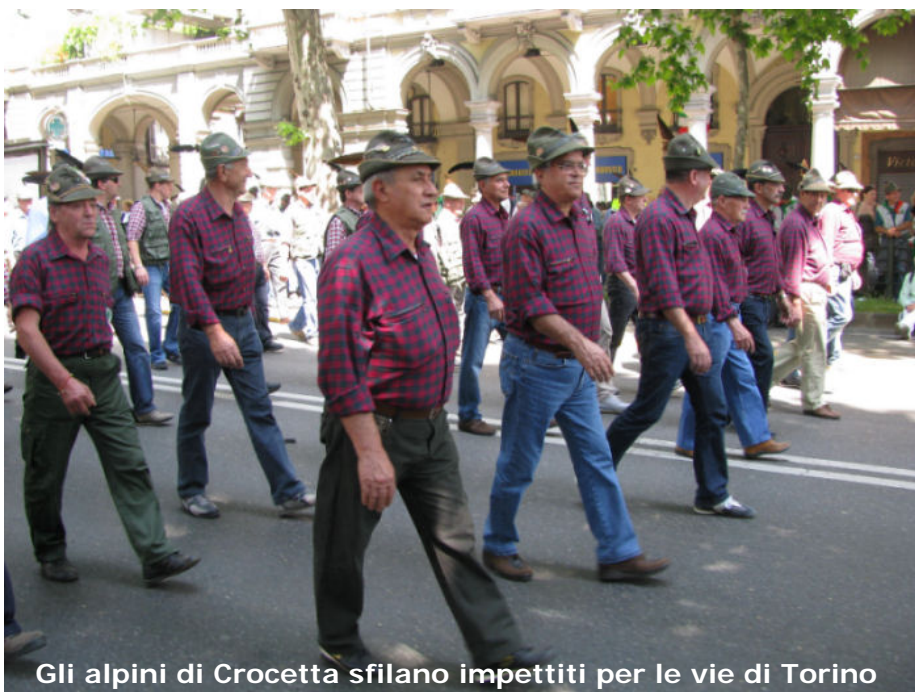
Gli alpini di Crocetta sfilano impettiti per le vie di Torino

Un percorso di quasi quattro chilometri completamente immerso tra due ali di folla plaudente. Ma, come dicevamo all'inizio, Torino va all'archivio e l'attenzione si rivolge ora a Bolzano dove si svolgerà la prossima adunata nazionale del 2012. Non possiamo mancare!