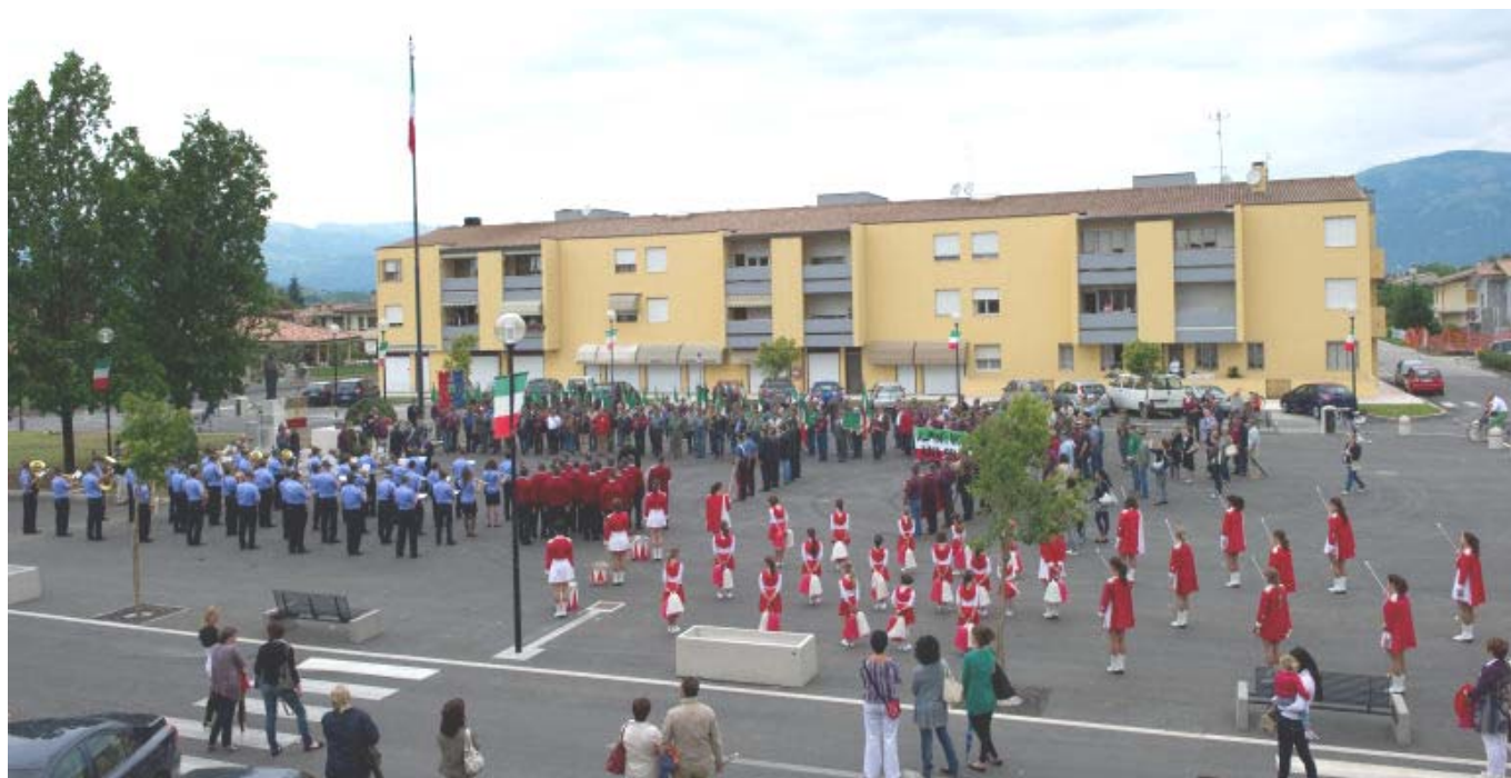
Piazza Mercato - Tutti pronti e schierati per l'Alzabandiera e gli Onori ai Caduti

Per il momento un grande ringraziamento tutti i collaboratori e appuntamento alle prossime occasioni di incontro.