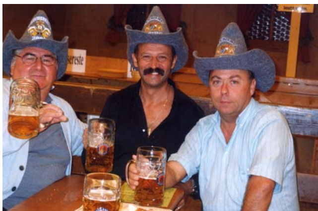
Quelli... un po' "seriosi"...