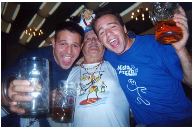
...e quelli più "allegrosi"

Albergo ottimo (pur con l'imprevisto delle camere... matrimoniali che ha "costretto" qualcuno, meno adattabile, a dormire sul pavimento) e, soprattutto, situato in posizione molto, ma davvero molto buona, a poche centinaia di metri dalla stazione ed a circa metà strada tra la sede della festa della birra ed il centro storico di Mo-