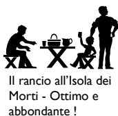
Il rancio all'Isola dei Morti - Ottimo e abbondante!

Come consuetudine, dopo la S. Messa nella Chiesetta in ricordo dei Caduti, rancio alpino preparato dai cucinieri del Gruppo.